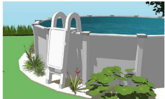
Exemple d'échelle munie d'une portière de sécurité.