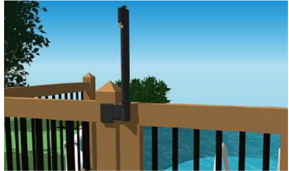
Exemple de loquet pouvant être installé du côté extérieur de l'enceinte, même lorsque celle-ci mesure moins de 1,5 m de haut.