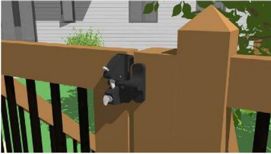
Exemple de loquet permettant à la porte de se verrouiller automatiquement. La porte devrait aussi être munie de pentures à ressort afin de se refermer automatiquement.