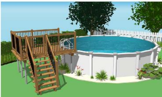
Exemple de plateforme dont l'accès est protégé par une enceinte.