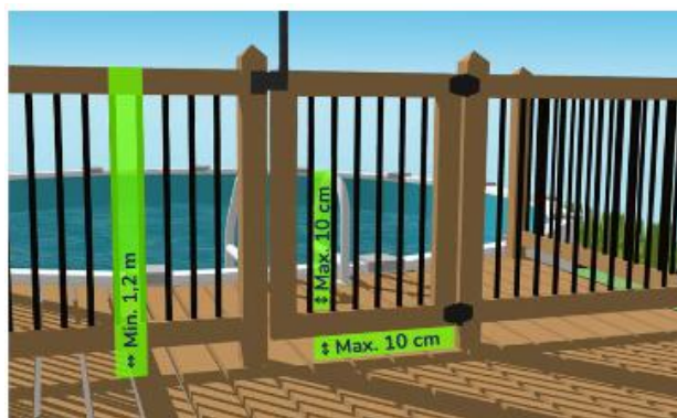
Dimensions exigées pour une enceinte.