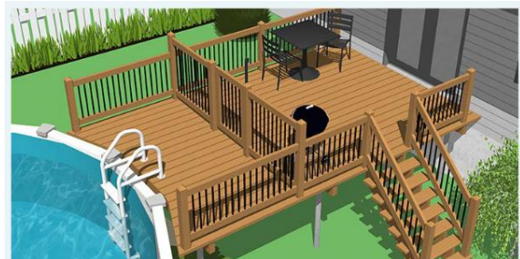
Exemple de terrasse rattachant la piscine à la résidence. La clôture empêchant l'accès à la piscine doit toujours avoir au moins 1,2 m de hauteur.